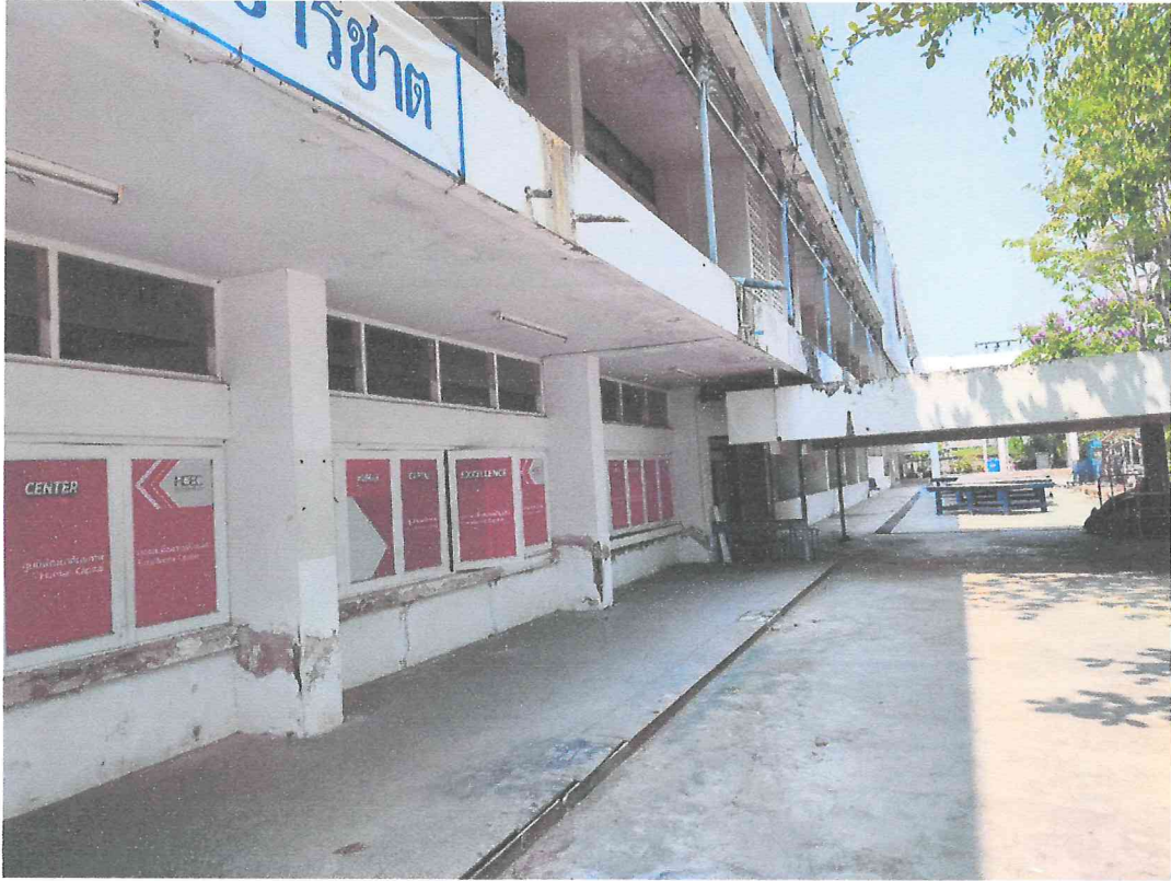
ภาพอาคารเรียนที่ประมุขชายทอดตลาด อาคารเรียน ๓ แบบ ๒๑๖ โรงเรียนอุดมทรูณี ตำบลธานี อำเภอเมืองสุโขทัย จังหวัดสุโขทัย