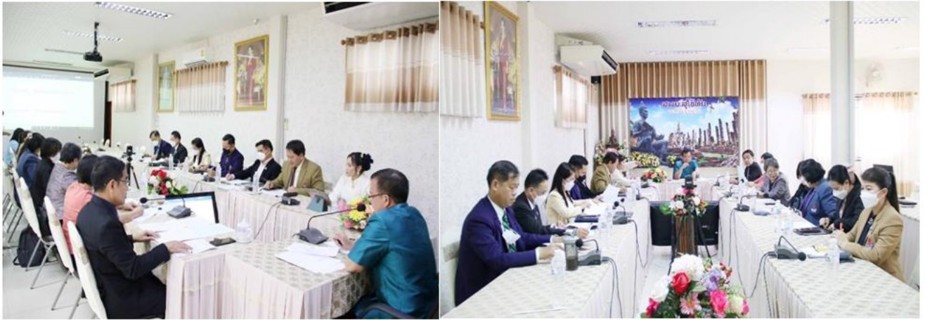
ประชุมการจัดทำร่างรูปแบบการขับเคลื่อนนโยบายสู่การปฏิบัติ วันที่ 9 พฤศจิกายน 2565