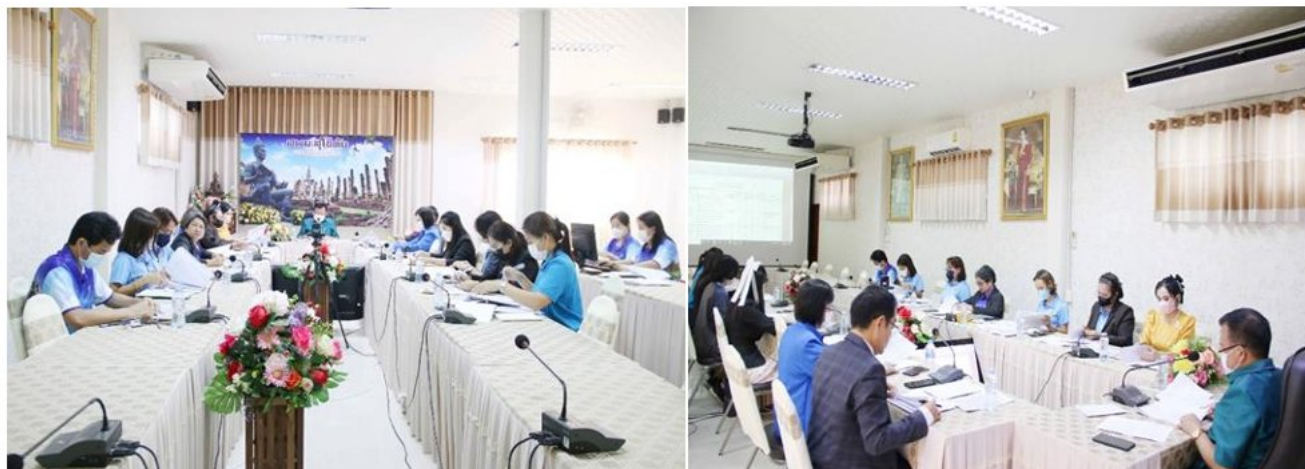
ประชุมการการจัดทำแผนปฏิบัติการประจำปีงบประมาณ พ.ศ. 2566 วันที่ 9 ธันวาคม 2565