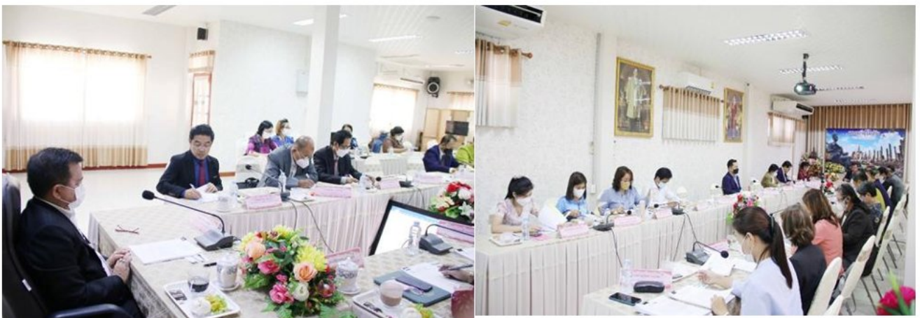
ประชุมการขับเคลื่อนแผนพัฒนาคุณภาพการศึกษา 5 ปี (พ.ศ. 2566 – 2570) วันที่ 17 พฤศจิกายน 2565