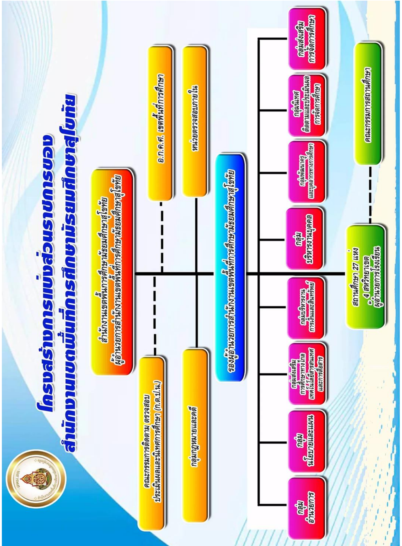
๑.๔ โครงสร้างการแบ่งส่วนราชการของสำนักงานเขตพื้นที่การศึกษามัธยมศึกษาสุโขทัย